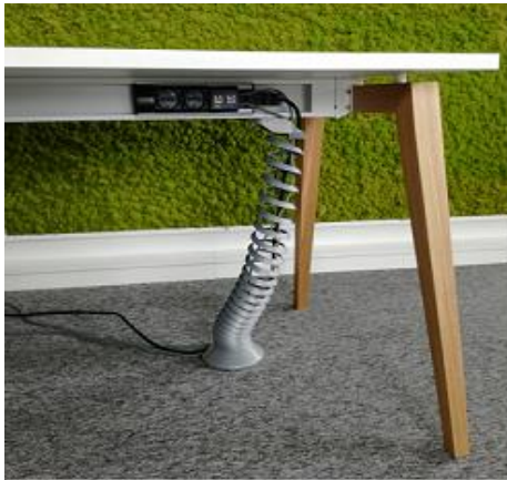
Table tops are available in two versions. (1) They can be made of 25mm thick melamine face chipboard, ABS edged. (2) They can be made of 25mm thick MDF, veneered in oak and lacquered, with a chamfered edge.

The bases of desks Feel are made of solid oak wood legs. The legs are connected with a metal beam which functions also as a cable channel for storing/connecting power units and cables. The legs have micro height adjustability.