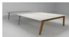
MIZA PISALNA DVOJNA NADALJEVALNA DOUBLE EXTENSION OFFICE DESK DOPPELVERKETTUNGSSCHREIBTISCH

1FE-00-04 140*80*H75 1FE-00-05 160*80*H75 1FE-00-06 180*80*H75