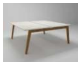
MIZA PISALNA DVOJNA DOUBLE OFFICE DESK DOPPELSCHREIBTISCH

1FE-00-01 140*80*H75 1FE-00-02 160*80*H75 1FE-00-03 180*80*H75