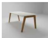
MIZA PISALNA OFFICE DESK SCHREIBTISCH

1FE-00-01 140*80*H75 1FE-00-02 160*80*H75 1FE-00-03 180*80*H75