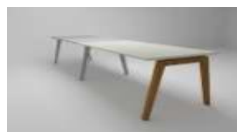
MIZA PISALNA NADALJEVALNA EXTENSION OFFICE DESK VERKETTUNGSSCHREIBTISCH

1FE-00-04 140*80*H75 1FE-00-05 160*80*H75 1FE-00-06 180*80*H75